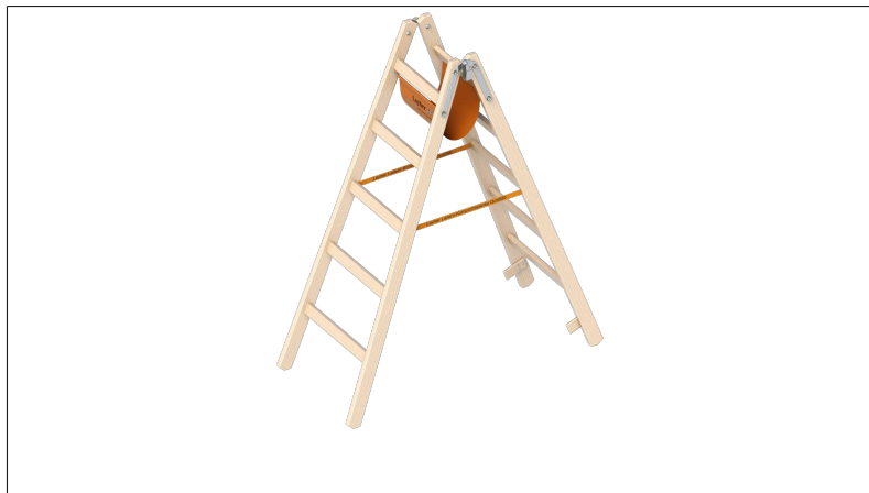
Die klassische Stehleiter aus Holz.