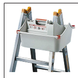
TOPIC Box 1016.021