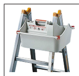
TOPIC Box 1016.021