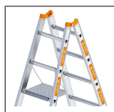
Einhängelattent- form 1016.003