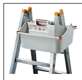
TOPIC Box 1016.021