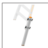
TOPIC Holmverlängerung 1016.109