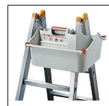
TOPIC Box 1016.021