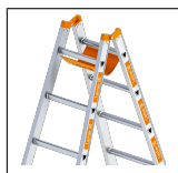
Einhänge- tasche mit Haken 1016.014