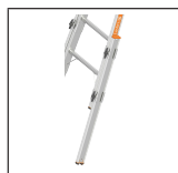
TOPIC Holmverlängerung 1016.108