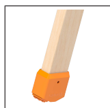
Leiterschuh für Holzleiter 1016.052