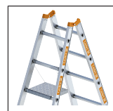
Einhängeplatt- form 1016.003