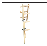
Holzhol- Verlängerung EasyFix 1016.022