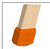
Leiterschuh für Holzleiter 1016.053